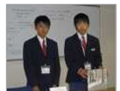
絵本紹介の発表会の様子