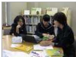
絵本の紹介作成中の様子