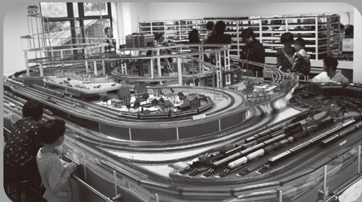
模型館の運転会の動画をInstagramにて公開中。 https://www.instagram.com/tfuskytrain/