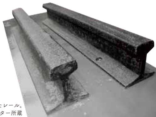
日本鉄道上野～仙台・塩釜が開通したときに敷かれたレール。 塩竈市民交流センター所蔵

この企画展では、「遺産」の認定があるなしに関わらず、古い鉄道の歴史を伝えてくれる、今も現役の鉄道施設や、かつて活躍した廃線路線の遺構や痕跡を、普段見過ごしてしまう身近な風景の中に見つけだし、その歴史的意義を探ります。