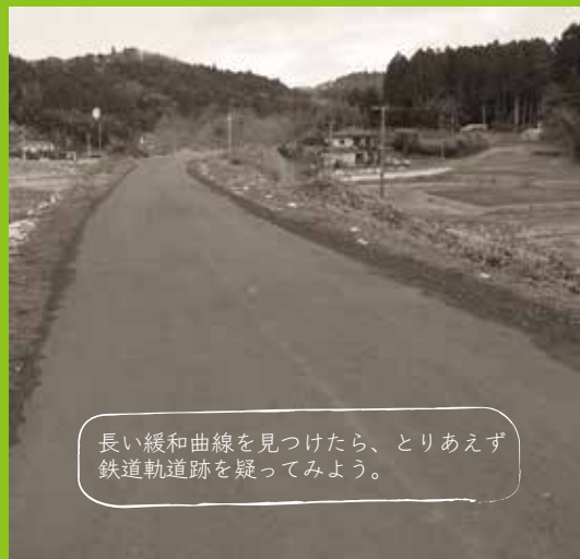
長い緩和曲線を見つけたら、とりあえず鉄道軌道跡を疑ってみよう。