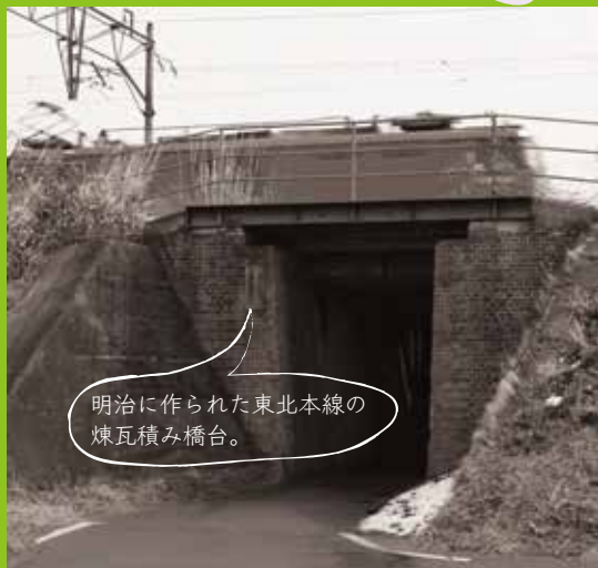
明治に作られた東北本線の煉瓦積み橋台。