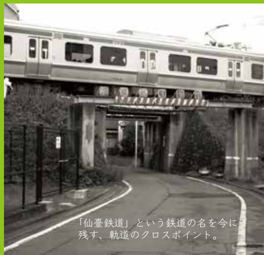
「仙臺鉄道」という鉄道の名を今に残す、軌道のクロスポイント。