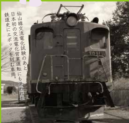
仙山線交流電化試験のあと、日本初の交流電化営業運転にも使われた鉄道史にエポックを刻む車両。