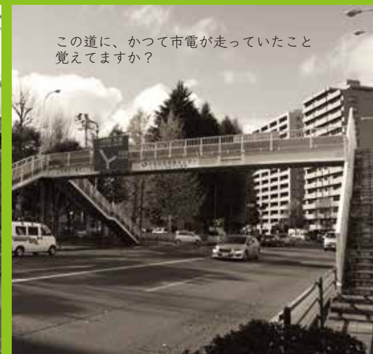
この道に、かつて市電が走っていたこと覚えてますか？