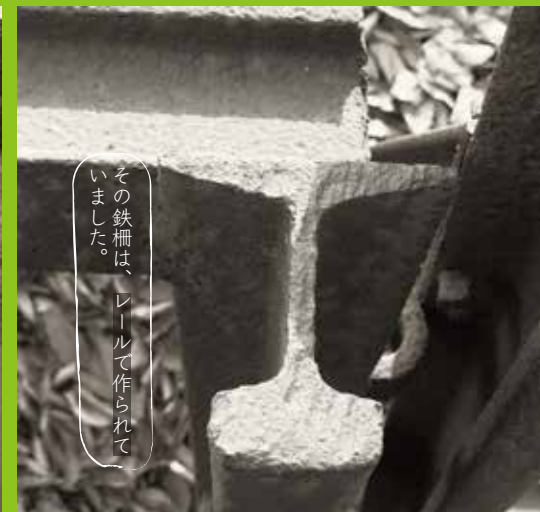
その鉄柵は、レールで作られています。