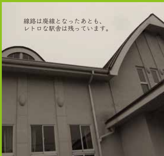
線路は廃線となったあとも、レトロな駅舎は残っています。